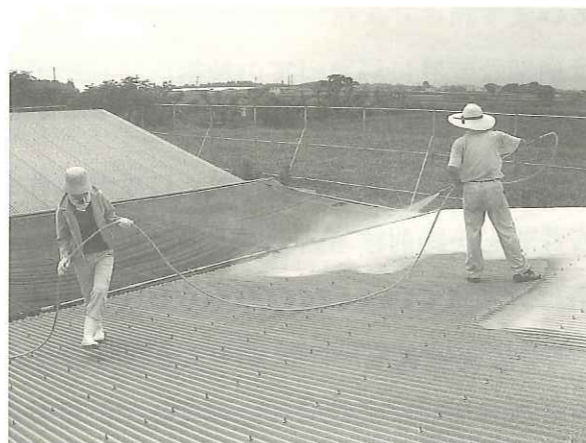
（写真1 石灰乳塗布の様子）