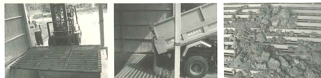
荷受場所に取り付けたスノコ

最近、粒状の乾燥鶏ふんが安価に入手できるようになりましたが、ふるいをかける前の半製品は、さらに安価です。粒状鶏ふんは、スパウト先端のナイロンストラップを取り外したブロードキャストで容易に定量散布が可能ですが、できれば、写真のようなL字鋼で作成したスノコで大きなカタマリを除去すると散布がスムーズになります。ぜひお試しください。