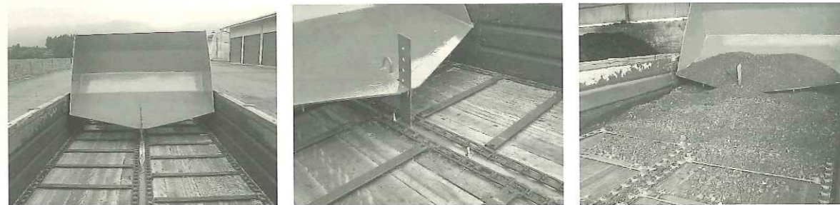
改良を重ねたすり切り