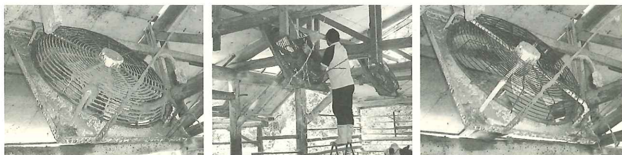
(写真1) 汚れたファンのフィルターの清掃 (Before/After)

私たちは、畜舎に設置されているファンの清掃が消費電力に及ぼす影響を検討しました。写真2は清掃前後のファンの様子ですが、羽に付着したほこりの量にびっくりしながら清掃