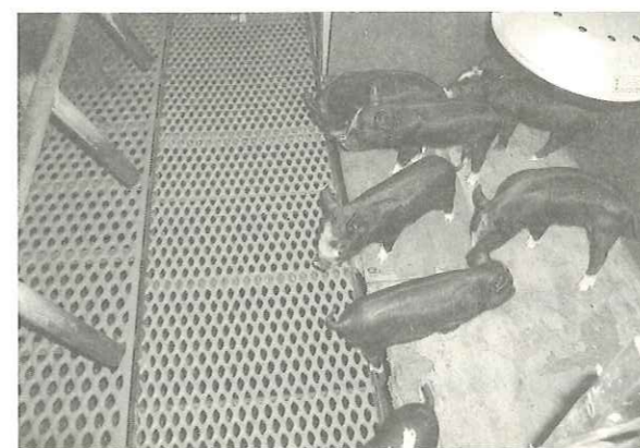
きれいな分娩ゲージの中で粒の揃った哺乳豚

また、1腹ごとに離乳まで使用した「ふんかき棒」は、高温高圧洗浄機で熱消毒しています。