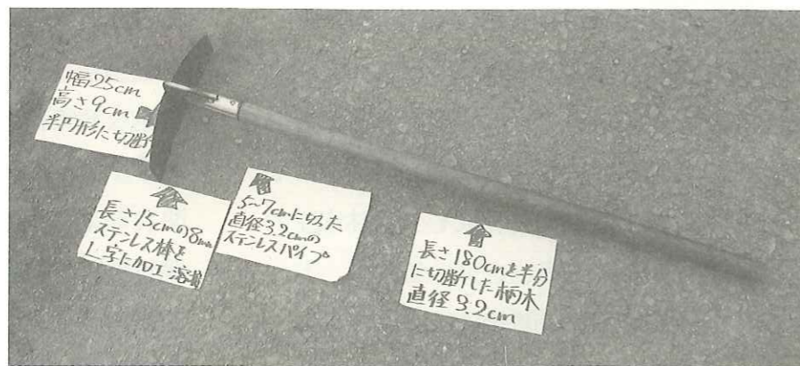
「ふんかき棒」全体写真

木の柄とステンレス製の棒、パイプはホームセンターで購入し、費用は1本当たり600円程度です。