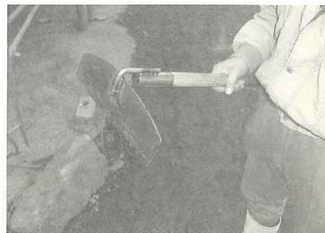
手軽に作れるT字型の「ふんかき棒」

その1つとして、哺乳豚の良好な発育と事故軽減のために、分娩ゲージ内を常に清潔に保ちたいと考え、手軽に分娩ゲージを清掃できるものとして、不要となった餌箱の再利用を思いつき、作成してみました。